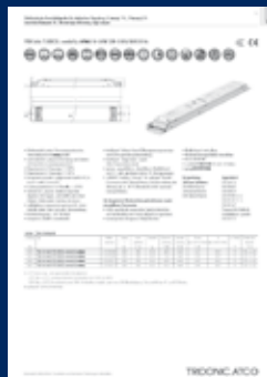
Datenblätter auf www.tridonic.com unter „Technische Informationen“