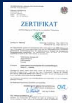
Zertifikate auf www.tridonic.com , unter „Technische Informationen“